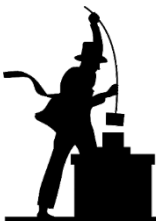
Požiarovosť vykurovacích telies, dymovodov a komínov za 1. polrok 2019 v Trenčianskom kraji