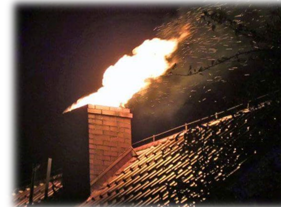
Požiarovosť vykurovacích telies, dymovodov a komínov za rok 2018 v Trenčianskom kraji